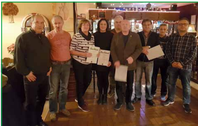
Die Jubilare beim Gruppenfoto