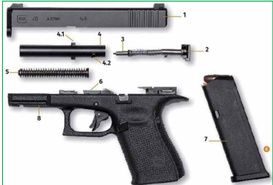
So sieht die Glock 46 zerlegt aus.

Die Arbeitsgruppe „Neue Dienstpistole“ im TPA (zusammengesetzt aus Schießausbildern aller Polizeibehörden und -einrichtungen und den Waffenspezialisten des TPA) war für die Erstellung des Leistungsverzeichnisses und eines Testlaufs verantwortlich. Gemeinsam mit KollegInnen der ZED der Polizeidirektionen, des TPA und des LKA wurden umfangreiche Anwender-tests mit 100 PVB durchgeführt. Die technische Erprobung erfolgte durch