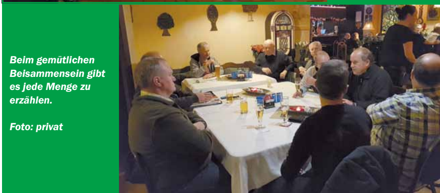
Beim gemütlichen Beisammensein gibt es jede Menge zu erzählen.