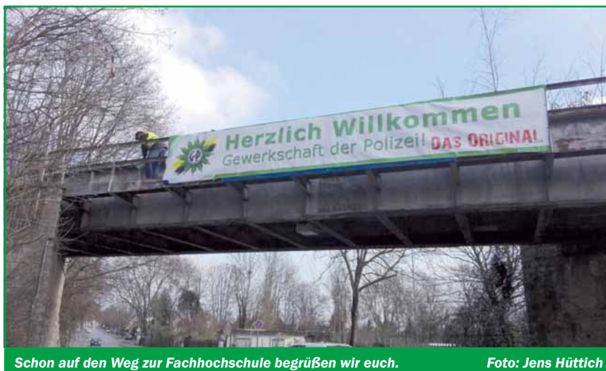
Schon auf den Weg zur Fachhochschule begrüßen wir euch.