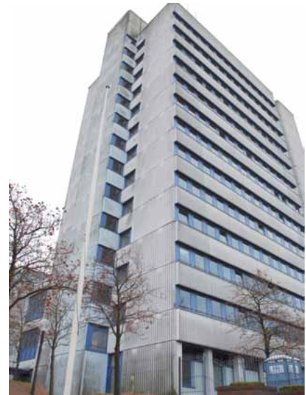
Das marode Dienstgebäude „Große Paaschburg 66“.