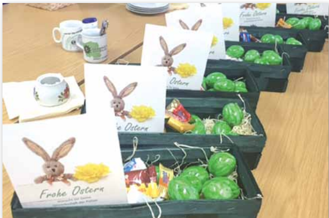
GdP-Ostergruß in der Osternacht: Die Körbchen sind gepackt für die Nachtdienste im Land.

für, dass junge Kolleginnen und Kollegen nicht überfordert und dabei Risiken ausgesetzt werden und der Wissenstransfer von erfahrenen zu jungen Beamten sichergestellt ist. Die Reihung der in der Osternacht