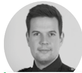
Max v. Buddenbrock Bereitschaftspolizei