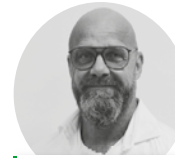
Andreas Votres Zentrale Dienste