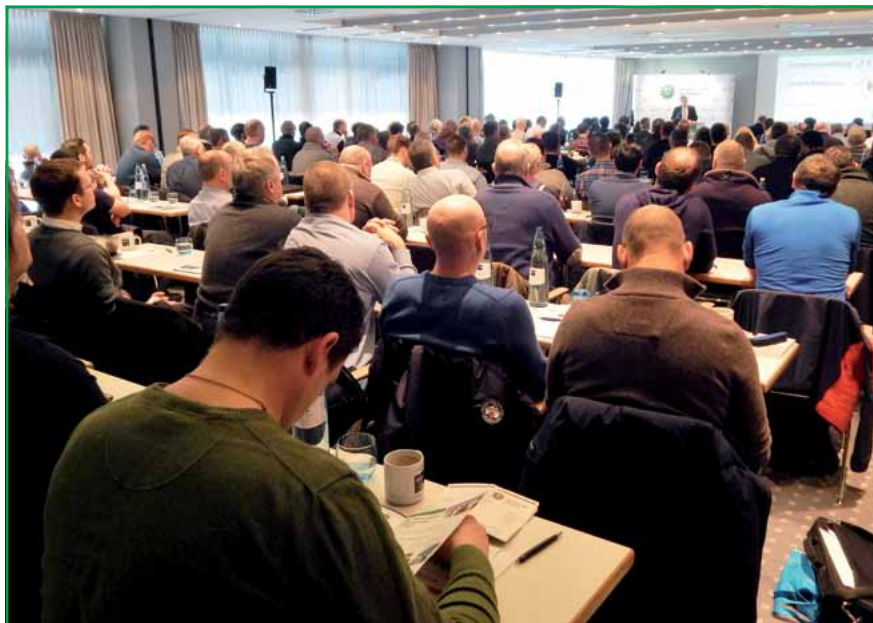
Das Interesse war riesig

Die eingeladenen Fachberater nahmen zu medizinischen, technischen und taktischen Fragen Stellung und berichteten über die Erfahrungen in der polizeilichen Praxis. Insbesondere die rechtliche Würdigung und Einordnung dieser Geräte im Polizeirecht sind von zentraler Bedeu-