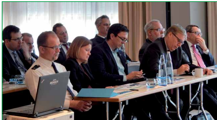
Die Innenpolitischen Sprecher aller Parteien waren ebenfalls anwesend.

Ergebnissen dieser Veranstaltung vertraut machen und in eine sachliche Diskussion über eine Einführung des Tasers über die Spezialeinheiten hinaus eintreten.