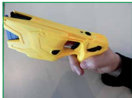
DEIG (hier ein Modell der Firma Taser)