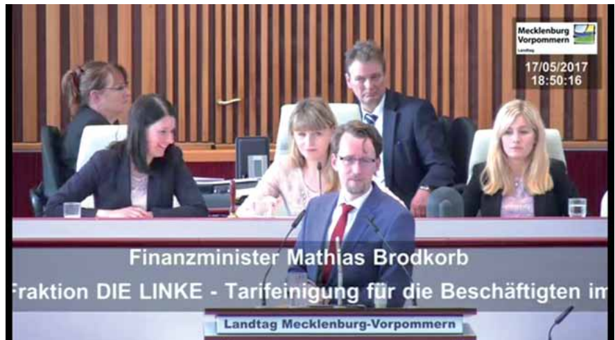
Mit den Stimmen der Regierungskoalition wurde der Antrag deutlich abgelehnt.

In seiner Sitzung am Mittwoch, dem 17. 5. 2017, beschäftigte sich der Landtag Mecklenburg-Vorpommern mit der Übertragung des Tarifergebnisses. Am Ende einer teilweise sehr hitzigen Debatte erfolgte die namentliche Abstimmung über einen Antrag der Fraktion DIE LINKE. In ihrem Antrag übernahm DIE LINKE die Forderung der GdP und forderte die zeit- und inhaltsgleiche Übertragung der Tarifergebnisse auf die Beamten und Versorgungsempfänger des Landes.