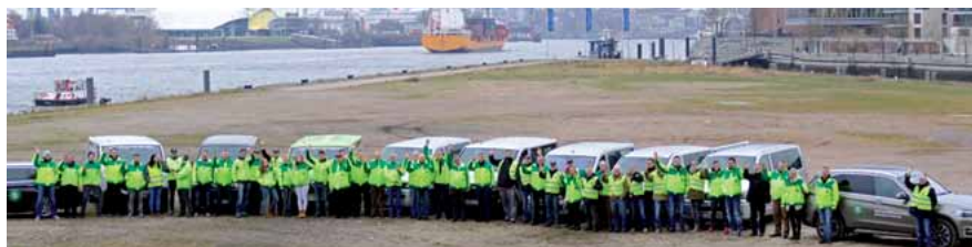
Von den Betreuer Teams ein herzliches Hallo aus Hamburg!

Schwerin/Hamburg. Anfang Juli steht für die Polizei mit dem G20-Gipfel in der Hansestadt an der Elbe ein großer Einsatz bevor. Um den Tausenden Kolleginnen und Kollegen aus ganz Deutschland den sicherlich viel abverlangenden Einsatz ein wenig zu erleichtern, wird auch ein Großaufgebot an Betreuern der Gewerkschaft der Polizei (GdP) vor Ort sein. Wir hoffen auf ein friedliches und glimpflich ausgehendes G20-Treffen! Passt auf euch auf und kommt immer gesund aus den Einsätzen nach Hause.