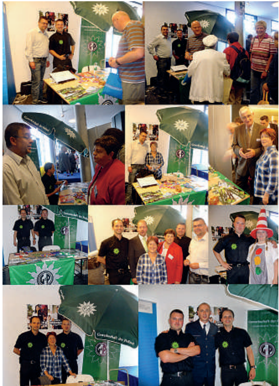
Impressionen vom Tag der offenen Tür