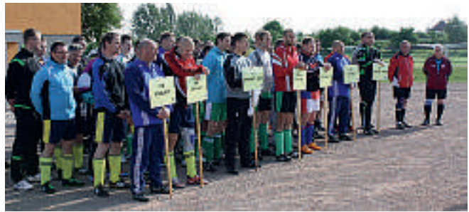
Während der Siegerehrung

Ohne die großzügige Unterstützung der Kreisgruppe Erfurt der Gewerkschaft der Polizei wäre aber die Ausge-