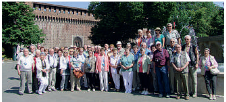
Gruppenbild unter italienischer Sonne

Am 6. Mai ging die Fahrt durch den Gotthardtunnel zurück in die Heimat. Insgesamt kann man sagen, die Reise war trotz des vielen Regens gut gelungen. Das