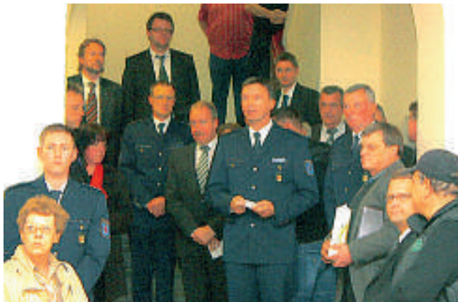
PD Loyer bei der Einweihung des Raumes der Stille

Auch wenn es eine nicht alltägliche Nutzung von einem Raum ist und sich der