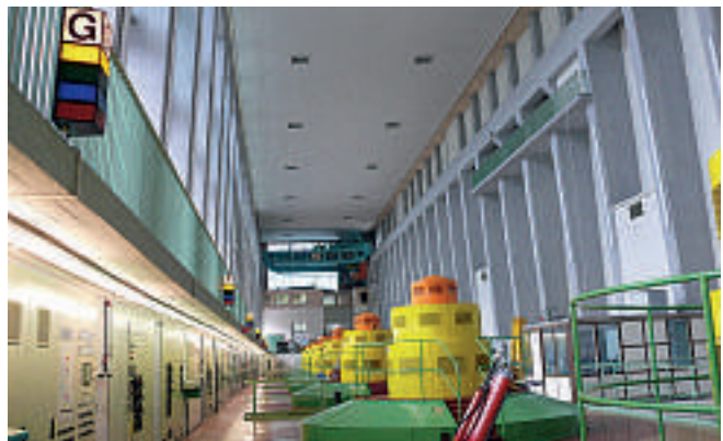
In der Maschinenhalle des Pumpspeicherwerks

Nach dieser Fülle von Informationen zur Energiegewinnung, welche die Erkenntnisse von einem früheren Besuch im Pumpspeicherwerk Goldistal wesentlich erweiterten, ging es zum gemeinsamen Mittagessen nach Kamsdorf in die Gaststätte Zollhaus. Hier stand an diesem Tag u. a. ein Schlachtfestessen zur Auswahl. Der Schlag der Tages war „Gebackenes Blut mit Beilage“, was vielen ausgezeichnet schmeckte.