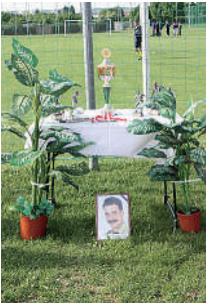
Die Pokale des Gedenkturniers