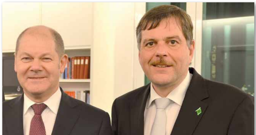
Zusammen mit dem designierten Finanzminister Olaf Scholz.