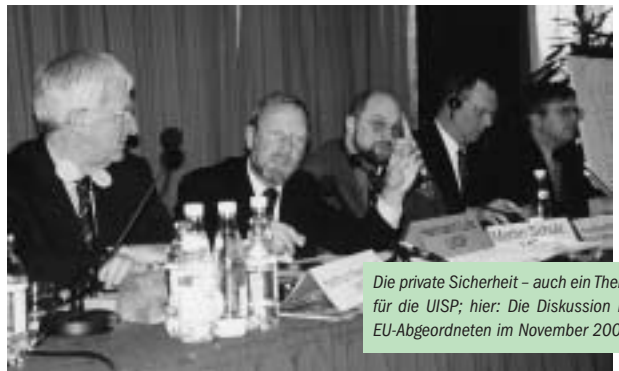
Die private Sicherheit – auch ein Thema für die UISP; hier: Die Diskussion mit EU-Abgeordneten im November 2000

Im Rahmen des vom UISP-Kongress 1999 beschlossenen Vierjahresplanes widmete die UISP ihren Schwerpunkt 2000 dem Thema „Polizei und private Sicherheitsdienste“. Auf der entsprechenden Veranstaltung im November 2000 in Brüssel referierten das zuständige EU-Kommissionsmitglied Antonio Vitorino sowie der Vorsitzende des Ausschusses für Bürgerfreiheiten und innere Angelegenheiten, Watson. Die Podiumsdiskussion unter Beteiligung von Verbandsvertretern des privaten