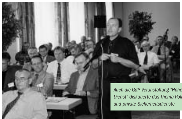
Auch die GdP-Veranstaltung "Höherer Dienst" diskutierte das Thema Polizei und private Sicherheitsdienste

beigetragen, dass einerseits Polizei und andere staatliche Institutionen ihre Aufgaben für die innere Sicherheit nicht in dem vom Bürger gewünschten Umfang mehr wahrnehmen können und andererseits private Sicherheitsdienste in die so entstandene „Marktlücke“ drängen. Daher war es geboten, dass die