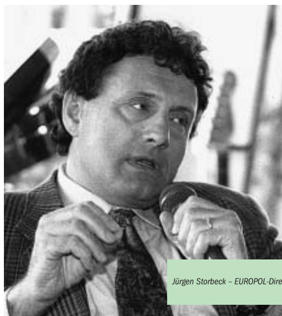
Jürgen Storbeck – EUROPOL-Direktor

Unter Beachtung von Artikel 30 des Amsterdamer Vertrages wird es künftig darum gehen, die operative Rolle von EUROPOL Zug um Zug auszubauen.