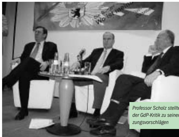
Professor Scholz stellte sich der GdP-Kritik zu seinen Kürzungsvorschlägen

Der Berliner Senat hatte im Jahr 2000 wegen der anhaltenden Haushaltsprobleme eine Expertenkommission „Staatsaufgaben-Kritik“ unter dem Vorsitz des Verfassungsrechtlers, Prof. Dr. Rupert Scholz, eingerichtet. Diese Kommission hatte in einem