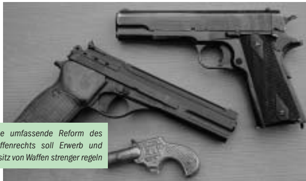
Eine umfassende Reform des Waffenrechts soll Erwerb und Besitz von Waffen strenger regeln

Dieser Entwurf sah zu dem für den GdP wesentlichsten Punkt, nämlich die Einführung eines kleinen Waffenscheins für Gaspistolen, eine Regelung vor, die dem Handel praktisch die Zuverlässigkeitsprüfung des Erwerbers zuschrieb. Die GdP hatte hierzu rechtliche Bedenken erhoben. Ein überarbeiteter Gesetzentwurf mit Stand von Juli 2001 sah dann überhaupt kein Erwerbserfordernis mit Ausnahme der Altersgrenze von 18 Jahren für Gaspistolen mehr vor, verlangte allerdings für das Führen dieser Waffen einen Waffenschein.