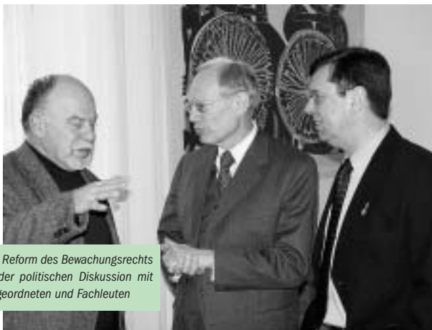
Die Reform des Bewacherrechts in der politischen Diskussion mit Abgeordneten und Fachleuten

Zwischen Bundeswirtschafts- und Bundesinnenministerium war im Frühjahr 2001 der Referentenentwurf zur Änderung des Bewacherrechts ausgehandelt worden, der den Interessen der inneren Sicherheit sowie der dringend notwendigen