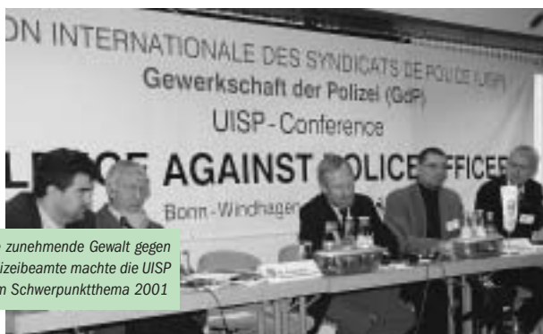
Die zunehmende Gewalt gegen Polizeibeamte machte die UISP zum Schwerpunktthema 2001

Die GdP hatte im Sommer 2001 daraufhin angeboten, eine Fachkonferenz zu der alltäglichen Gefährdungssituation von Polizeibeamtinnen und -beamten im Dezember 2001 durchzuführen. Bei dieser Konferenz am 11. Dezember 2001 wurden in Fachreferaten internationaler Experten und Diskussionen mit den Teilnehmern die Gründe der wachsenden Gewalt