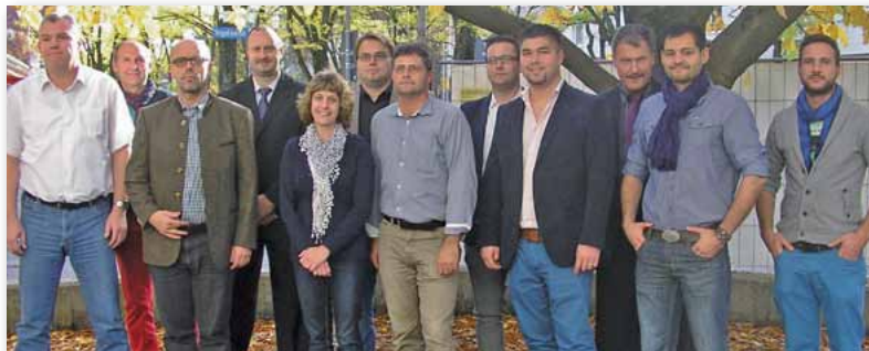
Die Vorstandschaft der BG Oberbayern Nord

Für das Polizeipräsidium Oberbayern Nord sprach Polizeipräsident Walter Kimmelzwinger über aktuelle polizeiliche Probleme. Die Dienststellen im Präsidialbereich seien arbeitsmäßig hoch belastet, weshalb zukünftige Personalzuteilungen auch entsprechend dieser Arbeitsbelastung erfolgen müssten. Insgesamt sei die Sicherheitslage im bayerischen Vergleich gut, allerdings bereiteten die steigenden Fallzahlen bei den Wohnungseinbrüchen Sorge. Hier solle mit mehr Kontrollen dagegehalten werden. Auch das Thema Gewalt gegen die Polizei bereite Sorge: nachdem nach einer internen Auswertung in 88% der Fälle der Täter unter Alkohol- oder Drogeneinfluss gestanden sei, solle wieder eine Sperrzeit eingeführt und der Verkauf von Alkohol an Tankstellen rund um die Uhr verboten werden. Er freue sich auf die weitere Zusammenarbeit mit den Gewerkschaften. Diese hätten in den letzten 30 Jahren sehr viele Verbesserungen für die Polizei erreicht. Auch