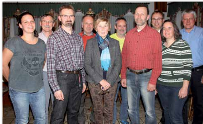
Die neue Vorstandschaft