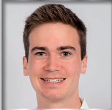
II. BPA Eichstätt