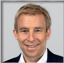
III. BPA Würzburg

wir freuen uns, Euch als neue Angehörige der Bayerischen Polizei begrüßen zu dürfen!