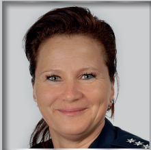
IV. BPA Nürnberg

Ihr wurdet zum 1. September 2022 in den Standorten der Bereitschaftspolizei Eichstätt, Würzburg, Nürnberg, Königsbrunn, Sulzbach-Rosenberg und Nabburg sowie im AS Spitzensport eingestellt. Die GdP heißt Euch als große und starke Solidargemeinschaft willkommen.