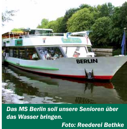
Das MS Berlin soll unsere Senioren über das Wasser bringen.