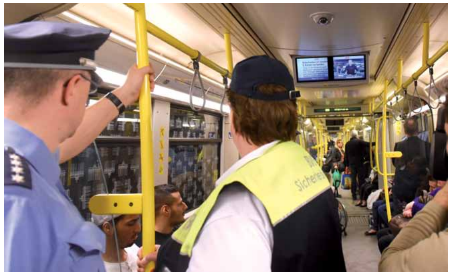
Anfang April gingen Polizei und BVG-Mitarbeiter im Rahmen eines Präventionstages in der Dir 6 gemeinsam auf Streife.

Nikutta: Das ist eine der schwierigsten Führungsaufgaben, eine Art Herkulesaufgabe. Wir sind jetzt 14.400 Mitarbeiterinnen und Mitarbeiter, da gibt es alle Charaktere. Wir als Vorstand versuchen, einen möglichst engen Kontakt zu den Mitarbei-