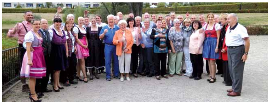
Beim Bayerischen Herbstfest trafen im vergangenen Jahr gut gelaunte Senioren und Aktive aus der Dir 5 zusammen.