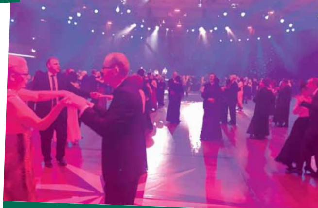
Ein Ball ist zum Tanzen da!