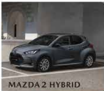
MAZDA 2 HYBRID