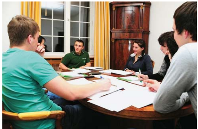
Konstituierende Sitzung – der neue Vorsitzende (Bildmitte)