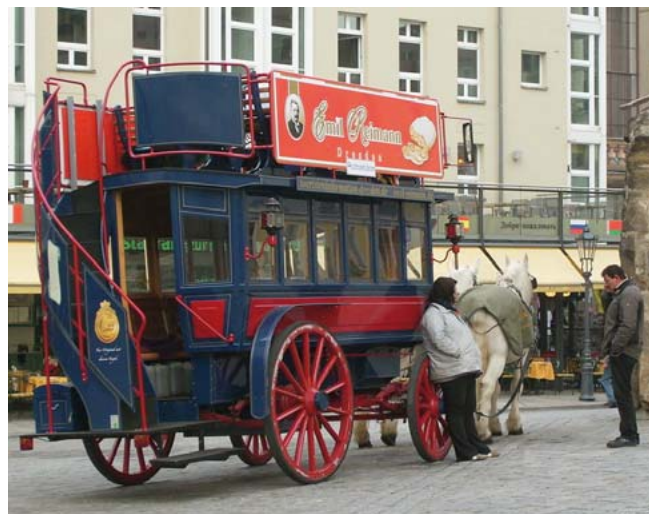
Zum Abschluss 'ne Kremserfahrt

die, das sei nochmals betont, ehrenamtlich die viele Arbeit auf sich genommen hatte.