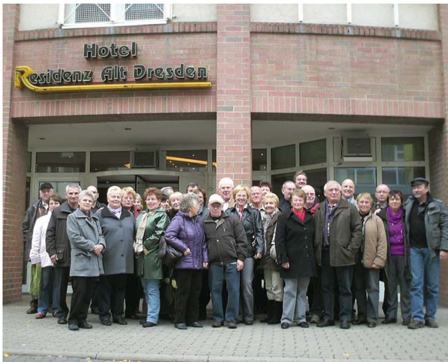
Die Teilnehmer/-innen der 1. Landesseniorenfahrt

Pünktlich zum Abendbrot waren wir wieder im Hotel.