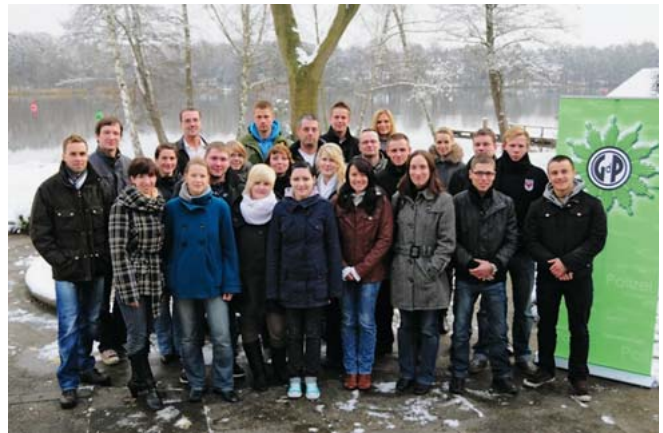
Die Delegierten zur Landesjugendkonferenz

Der zweite Tag begann mit der Eröffnung durch den neuen Landesjugendvor-