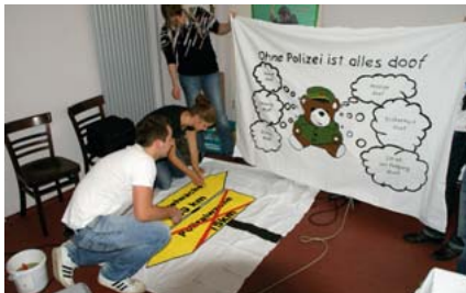
Künstler am Werk

Weihnachtsgeld, Neumitgliedergewinnung und Reform der Polizei (eigentlich Personalabbaukonzept) – das waren einige der zahlreichen Themen, die uns in den letzten Tagen und Wochen beschäftigten.