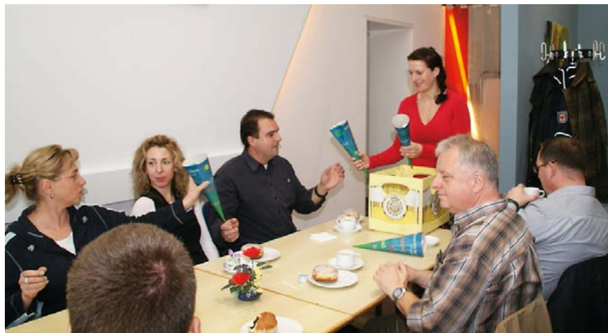
Alles Gute und viel Erfolg beim Lernen