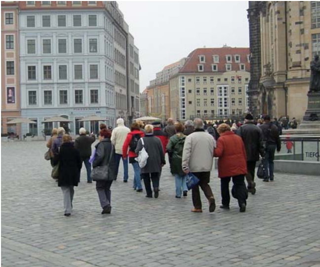
Rundgang an der Frauenkirche

Abstecher in die „Gläserne Manufaktur von Volkswagen“ stand an. Mitten in Dresden wird in diesem Haus der Phaeton gefertigt. Er ist ein Oberklassemodell von VW. Zugegeben, wohl keiner von uns zählte zu dem Kundenstamm des Hauses, woran sich auch in naher Zukunft kaum etwas ändern wird. Die Führung war aber doch sehr freundlich. So ein technischer Ablauf, in dem innerhalb von 4 Tagen in Handarbeit ein Auto auf die Räder gestellt wird, ist schon interessant. Ein Trost blieb uns, das Modell entsprach nicht unseren Wünschen und Ansprüchen, da half auch die ganze Werbung nichts. Am Nachmittag ging es in die berühmte Semperoper. In dem Haus der Sächsischen Staatsoper Dresden könnte man stundenlang Details in Ma-