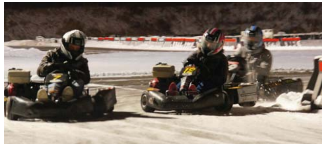
Vertrauensleute am Steuer

schied zur Realität ist nur, dass das Kartfahren am Abend des ersten Seminartages auf der 1,4 km langen Kartbahn in Schönerlinde viel mehr Spaß machte.