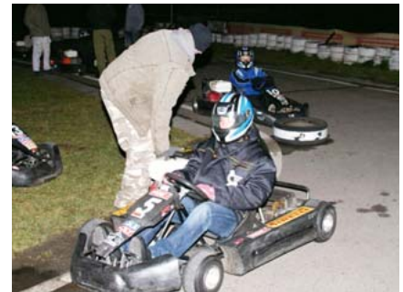
Mit 6,5 PS, einem Liter Benzin und einem Becherchen Glühwein an den Start.

sich dadurch gravierend. Der Bürger hat einen Anspruch, in welcher Zeit bei Notfällen ärztliche Hilfe vor Ort ist. Warum denken seit Jahren die politisch Verantwortlichen, dass dies bei der Polizei nicht geregelt werden muss. Für eine öffentliche Daseinsvorsorge muss polizeiliche Hilfe immer und in angemessener Zeit zur Verfügung stehen. Der Ruf der Poli-