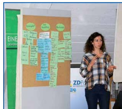
Präsentation der Ergebnisse

Was alle Arbeitsgruppen forderten, war etwas, das mit technischen Mitteln nicht zu erreichen ist: eine Verbesserung der zum Teil unklaren und wenig praktikablen Führungsstrukturen im Zuge der Umstrukturierungen und Reformen. Dann, so der Tenor, könnte unter anderem auch besser durchgesetzt werden, dass auf den Dienststellen auch tatsächlich das passende Fahrzeug für die entsprechende Aufgabe eingesetzt wird. Das Resümee der Tagung war mehr als deutlich: „Das hier kann nur ein Auf-