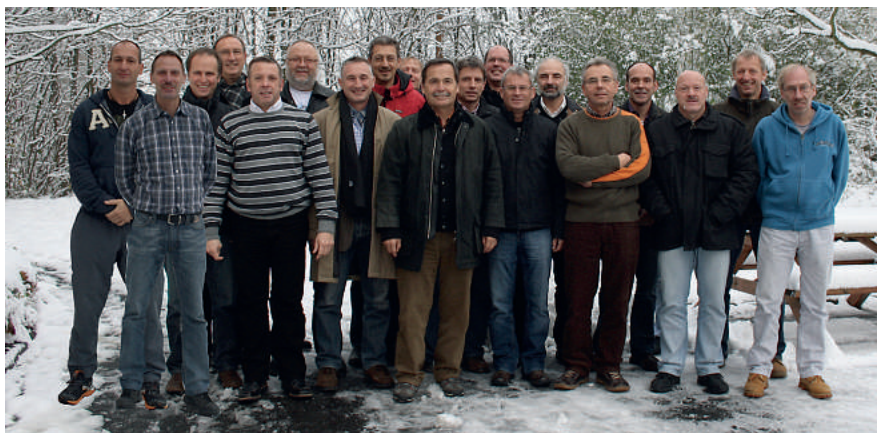
Die Teilnehmer der Personalräteschulung für Vorstände.

Einerseits ging es bei der GdP-Schulung um die formale Seite: Welche Aufgaben hat der Vorstand, wie fasst das Gremium einen wirksamen Beschluss, was gehört in das Protokoll und vieles mehr. Auf der anderen Seite um die speziellen Probleme als Manager des Personalrats: Wie werden interne Konflikte