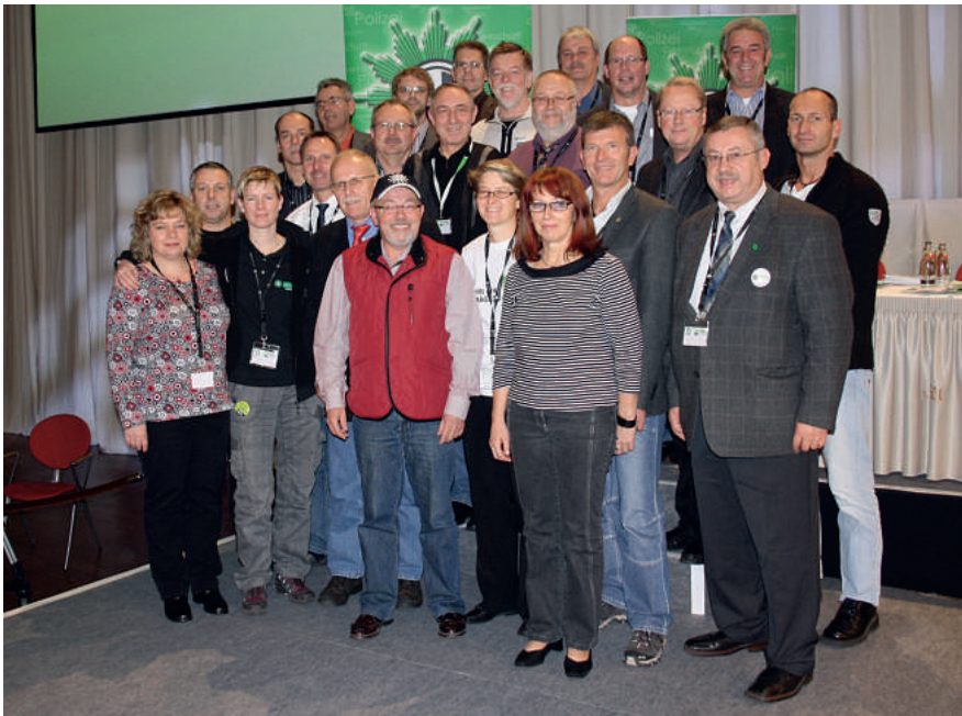
Die Delegierten und Teilnehmer aus Baden-Württemberg.