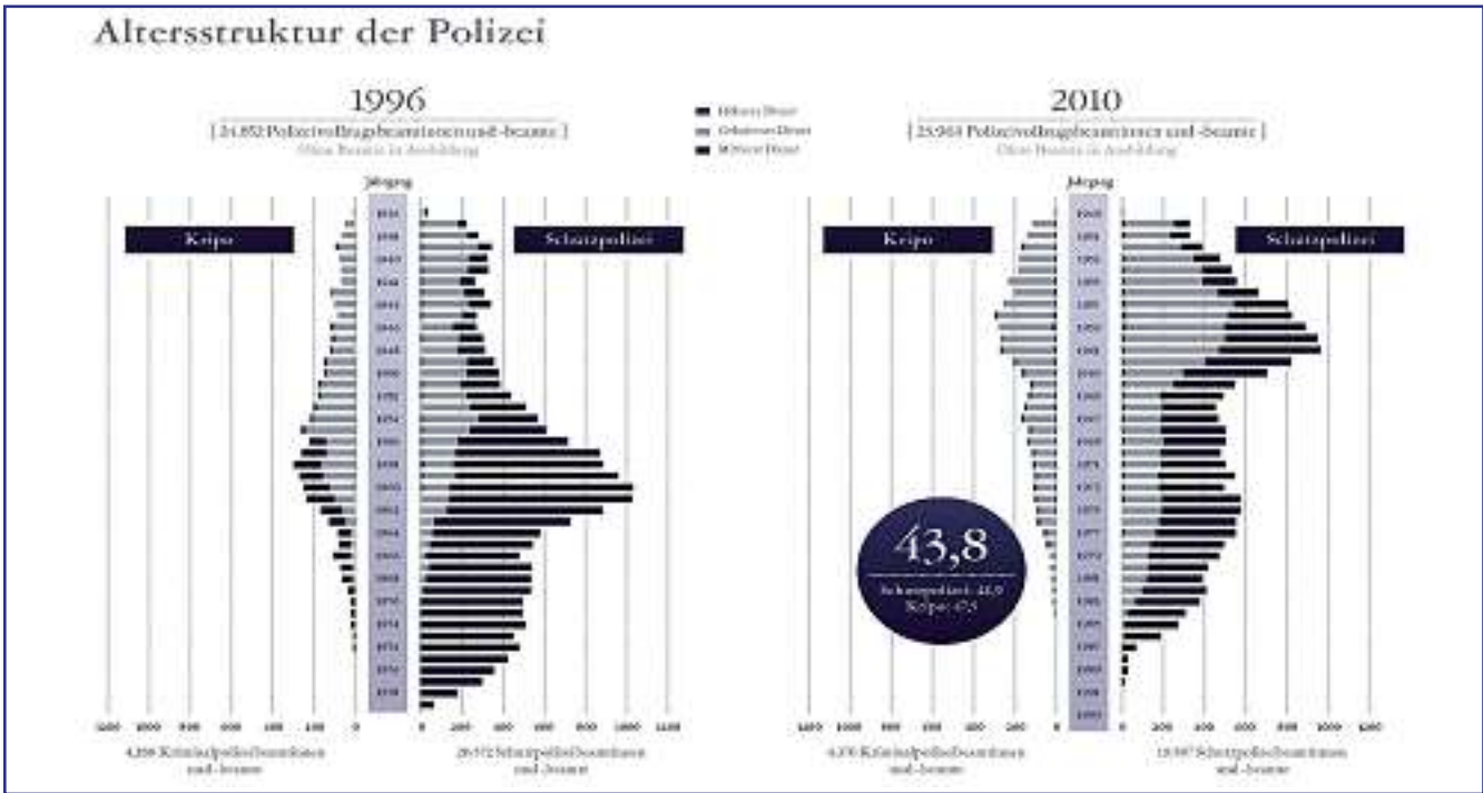
Quelle: Die Polizei Baden-Württemberg, Menschen – Daten – Zahlen 2010, IM BW