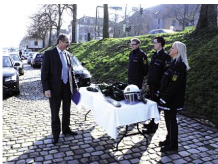
Die Junge Gruppe präsentierte den Journalisten die Körperschutzausstattung (KSA), hier im Gespräch mit Innenminister Reinhold Gall