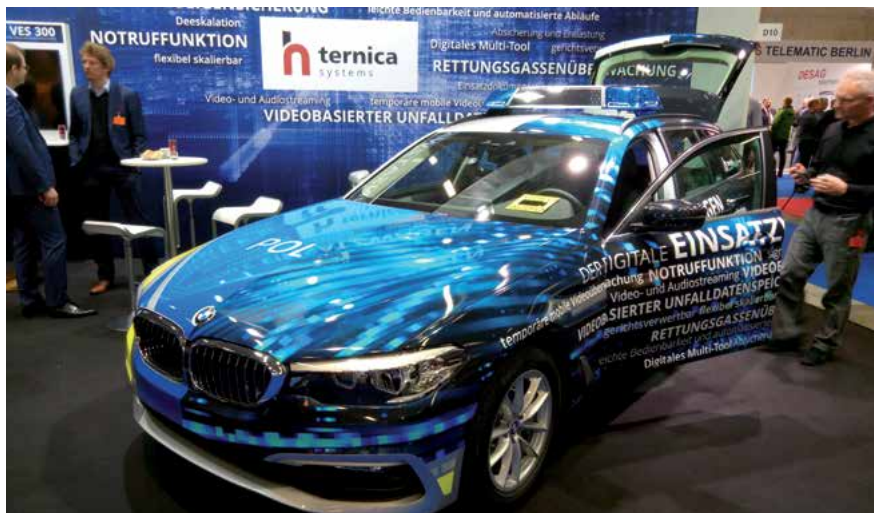
Der Trend geht zum digitalen Streifenwagen – Verschlüsselungstechnik – wichtiger denn je

Ein großer Schwerpunkt lag in der Automatisierung und Vernetzung bzw. Verarbeitung von bereits vorhandenen Daten. So haben gleich mehrere Hersteller (neue) Systeme für einen digita-