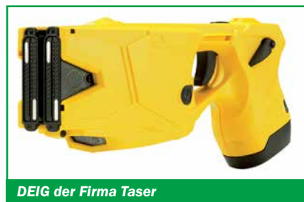
DEIG der Firma Taser

Nach dieser Veranstaltung hat der Landesvorstand der GdP Hessen einstimmig beschlossen, mit der Forderung nach einem Pilotversuch an den Innenminister heranzutreten. Dieser Forderung kam Innenminister Beuth