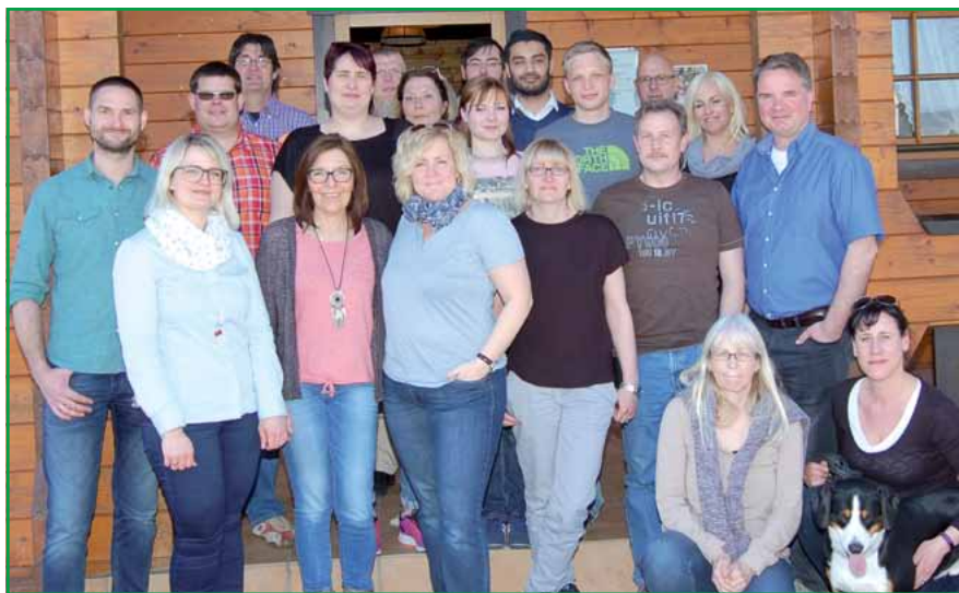
Die Teilnehmer des Seminars in Zella

2. Seminar für Kolleginnen und Kollegen aus GdP-Vorständen in Zella