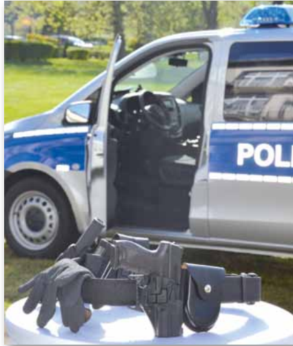
Standardausrüstung unserer Kolleginnen und Kollegen – der Funktionsgürtel und Fahrzeug/Fahrzeugsitz müssen zusammenpassen.

430 Kolleginnen und Kollegen aus dem Schicht- und Wechseldienst, die regelmäßig mit dem Opel Insignia Tag und Nacht unterwegs waren und sind, hatten sich an der GdP-Umfrage beteiligt und somit ein kritisches Bild zu den Problemstellungen bei den Sitzen gezeichnet. In der „Deutsche Polizei“, Ausgabe Januar 2013, wur-