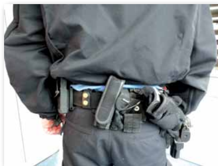
Schwäche an Einsatzanzug

Zwischen dunkelblauen Bekleidungsstücken herausragende andersfarbige Unterbekleidung erscheint schon rein optisch nachlässig, ungeordnet und somit unprofessionell. Die aktuelle hessische Unterbekleidung wird