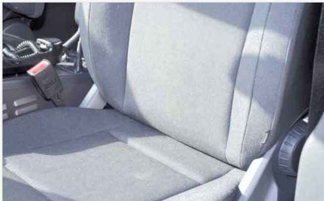
Der verbesserte Sitz des Vito

„... Für Fahrer- und Beifahrersitze der Funkstreifenwagen sind aktuell laut Technischer Richtlinie (Polizeitechnisches Institut der deutschen Hochschule der Polizei, 2010) bzw. dem Positionspapier der Gewerkschaft der Polizei (GdP) (Hölzgen, 2009) hochwertige Komfortsitze aus dem Serienprogramm der Automobilhersteller oder sogenannte AGR-Sitze (zertifiziert gem. ‚Aktion Gesunder Rücken e. V.‘) vorgesehen. Obwohl diese aus Sicht von ergonomischen Aspekten höherwertig sind, werden sie den Anforderungen für den polizeispezifischen Dienst nicht gerecht. Deutlich wird dies durch Zeitungsartikel über untaugliche Dienstwagen aufgrund von zu engen Sitzen (Frankfurter Rundschau, 2012) und die noch immer existente Aufforderung der Gewerkschaft der Polizei (GdP) an die Automobilindustrie, die sicherheitstechnischen und arbeitsphysiologischen Probleme zu beheben (Hölzgen, 2009). Ziel dieses Gutachtens ist es daher, die speziellen Anforderungen von Polizisten zu erheben, Lösungsvarianten für ergonomische Sitze für Funkstreifenwagen zu gestalten und zu bewerten sowie die Umsetzung von solchen polizeispezifischen Sitzen zu betrachten.“