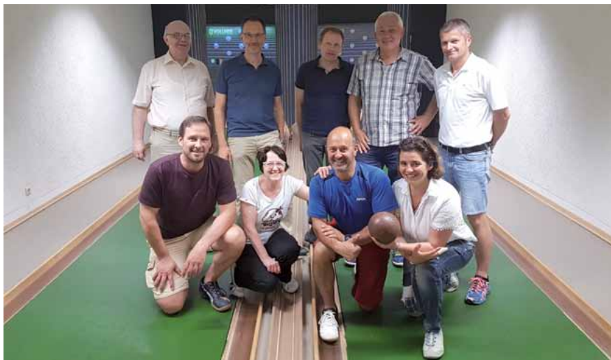
Gruppenbild einiger Aktiver beim Kegeln

Klein – aber fein – lautet unser Motto! Aus der ehemaligen Direktion der Bereitschaftspolizei wurde nach der letzten Polizeireform das Bereitschaftspolizeipräsidium. In diesem Zuge haben auch wir unseren Namen angepasst. Traditionell sind bei uns nicht die jüngsten Mitglieder organisiert, denn innerhalb der Bereitschaftspolizei finden die allermeisten erstmals Verwendung in den Einsatzeinheiten und den BFE'en. So auch am Standort Wiesbaden. Die Kreisgruppe findet man im Gebäude des Präsidiums. Hier versehen eigentlich alle, außer den pensionierten Mitgliedern, ihren Dienst. Daher fällt es uns auch nicht schwer, Informationen an Mitglieder zu bringen. Anstelle sturer Mails suchen wir auch gerne mal das Gespräch, bei einer Tasse Kaffee gelingt dies natürlich am besten. Stark organisiert bei uns sind unsere (unverzichtbaren) Pensionäre. Von 63 Mitgliedern sind es immerhin 18 inaktive Kolleginnen und Kollegen, die der GdP nach wie vor die Treue halten. In der Jahreshauptversammlung im März dieses Jahres berichtete der Vorsitzende in seinem Rechenschaftsbericht aus dem letzten Jahr. Neben zahlreichen Aktionen im Rahmen der andauernden Protestaktionen um die Beamtenbesoldung und den damit einhergehenden Demonstrationen der GdP, konnte auch in diesem Jahr ein Seniorentreffen gemeinsam mit der