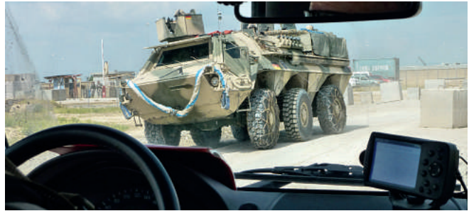
Auf Streife in Afghanistan.

Er machte deutlich, dass es für den Einsatz von Landespolizeibeamten grundsätzlich einer landesgesetzlichen Grundlage bedarf. Die hessischen Erlasse zur Regelung der Auslandsmissionen würden der verfassungsrechtlichen Not-