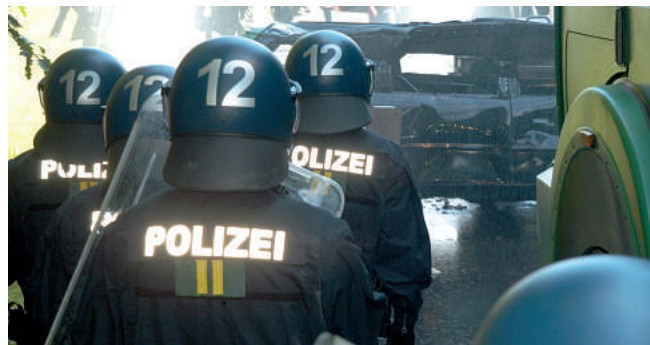
Die Gewalt gegen Polizeibeamte/-innen nimmt zusehends zu. Nicht nur die Ausrüstung und Dienstbekleidung müssen stimmen, sondern die hessische Polizei muss auch über ausreichendes Personal verfügen.

In Sachen Ausstattung und Bekleidung ist der frische Wind, der nach der Einführung der blauen Dienstbekleidung 2007 wehte, deutlich abgeflaut. Viele Beschäftigte haben sich bei uns über den schlechten Kundenservice im LzBW, der teilweise schlechten Qualität einzelner Dienstbe-