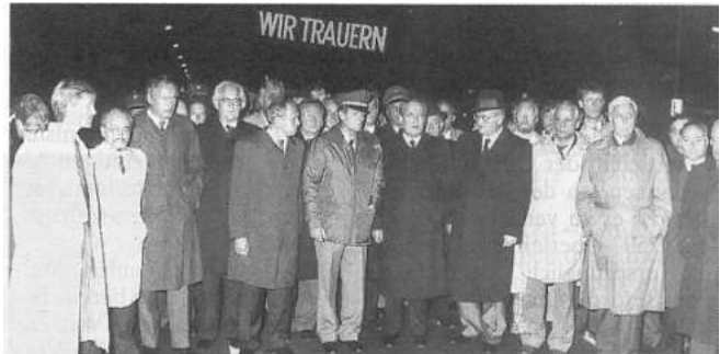
3. 11. 87 – Spontan-Demonstration von 7000 hessischen Polizisten durch die Frankfurter Innenstadt zum Paulsplatz unter Beteiligung der hessischen Politprominenz.