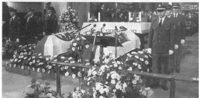
10. 11. 87 – Oekumenische Trauerfeier im Frankfurter Kaiserdom.