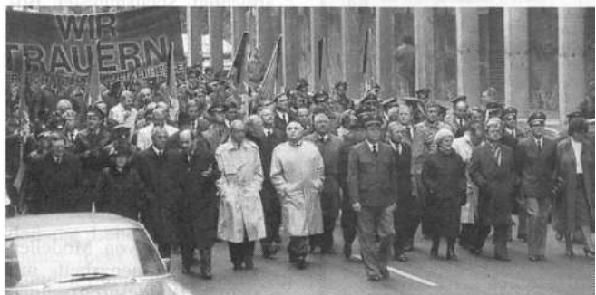
Nach der Trauerfeier: 20000 Polizisten aus allen Bundesländern folgten dem Aufruf der GdP zum Trauermarsch durch Frankfurt.