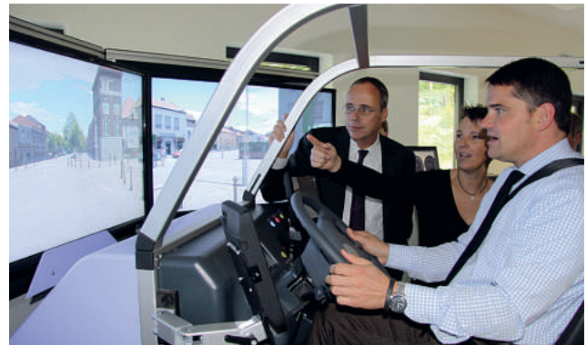
Innenminister Boris Rhein (rechts) testet den neuen Fahrsimulator.

Ein mobiler Verkehrssimulator bietet zudem die Gelegenheit, diesen auch für dezentrale Beschulungen, beispielsweise im nord- und osthessischen Bereich, einsetzen zu können.