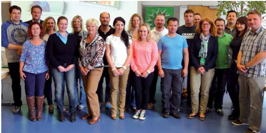
Die Teilnehmer des Bildungstages der Jungen Gruppe Nordhessen.

Bereits in den Werbebroschüren der Einstellungsberatung wird das Thema „Vereinbarkeit von Beruf und Familie“ bei der Polizei thematisiert.