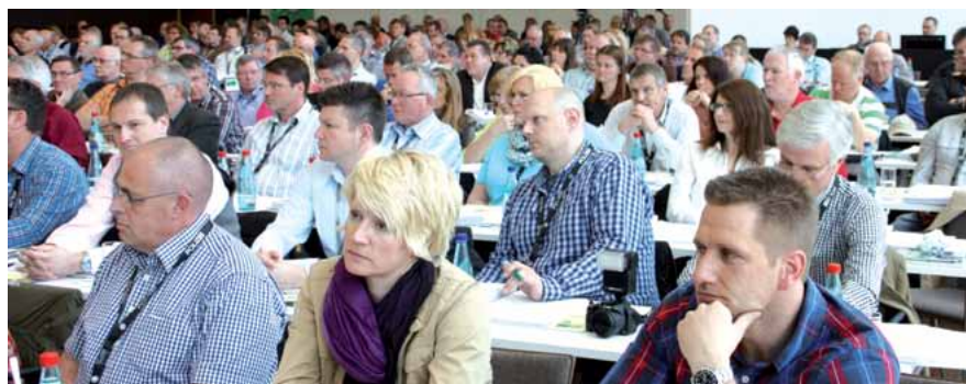
Die Delegierten des 25. Landesdelegiertentages.

Die weiteren Anträge befassten sich mit der Anerkennung von Vorzeiten in anderen demokratischen