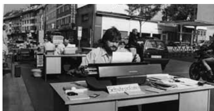
Aktion Büro auf der Straße