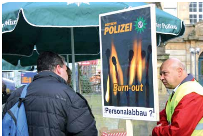
Nah am Bürger

Die GdP Nordhessen informierte die Bürger über geplante Beihilfekürzungen in Kassel und Hofgeismar.