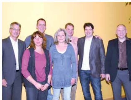
Der aktuelle Vorstand