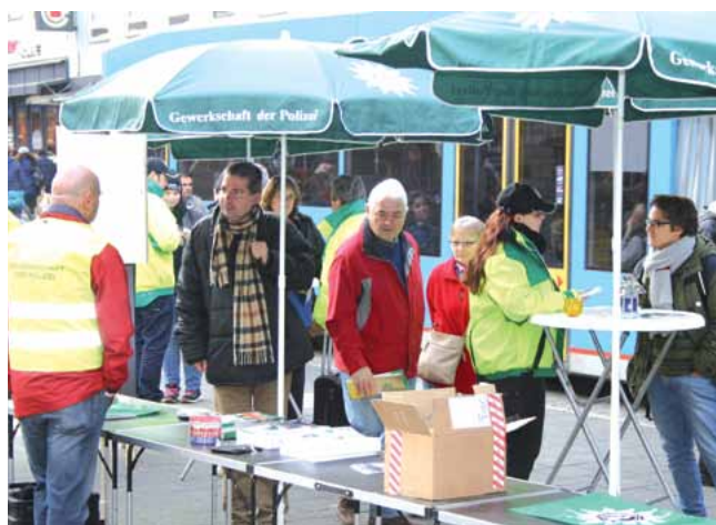
Großes Interesse in der Bevölkerung