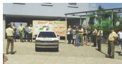
Aktion alter Dienstwagen