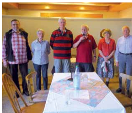
Die Theatergruppe Charly Braun