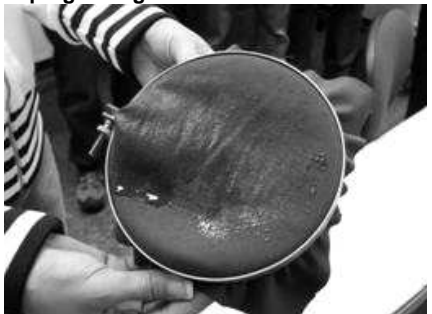
In kurzer Zeit komplett durchnässt – der alte grüne Anorak.