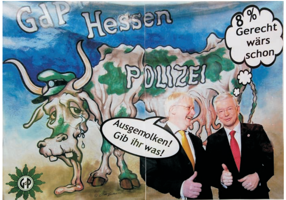
Bildunterschrift: Sitzungspause sinnvoll genutzt.

Unser Landesvorstand tagte zusammen mit der Tarifkommission in Gießen. Während einer Sitzungs-