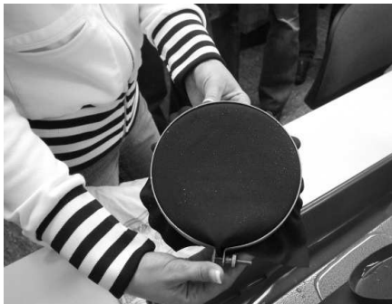
Der blaue Stoff (oben) zeigt sehr gute Imprägniereigenschaften.

Natürlich waren die Mitglieder des BFA-S gespannt, wie dieses erste Testverfahren verläuft.