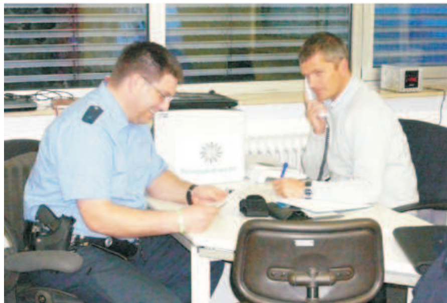
Personalrat vor Ort

Planungen wurden damit über den Haufen geworfen und haben unserer Kolleginnen und Kollegen eine Menge Probleme bereitet. Doch damit nicht genug, vor Ort im Einsatz müssen wir feststellen, dass wir genau das antreffen, womit wir seit Monaten rechnen – mit sehr wenig und kaum gewaltbereitem Widerstand von Ausbaugegnern. Kritik von mir kommt nicht im Bezug auf die fachkompetente Vorbereitung, unsere Führung versteht ohne Zweifel ihr Handwerk, aber genau in den zwei Punkten, in welchen wir unsere