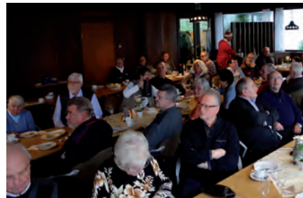
Aufmerksame Zuhörer lauschen dem PP