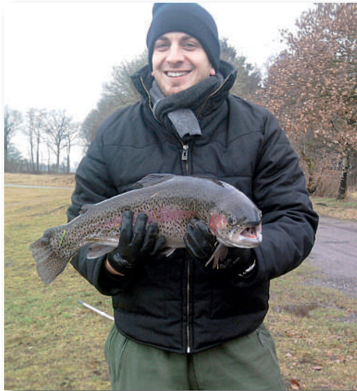
Kein Anglerlatein: Joes Anglerglück

Kosten: 17,- € für zwei Ruten (für Nichtmitglieder 20,- €) 14,- € für eine Rute (für Nichtmitglieder 17,- €)