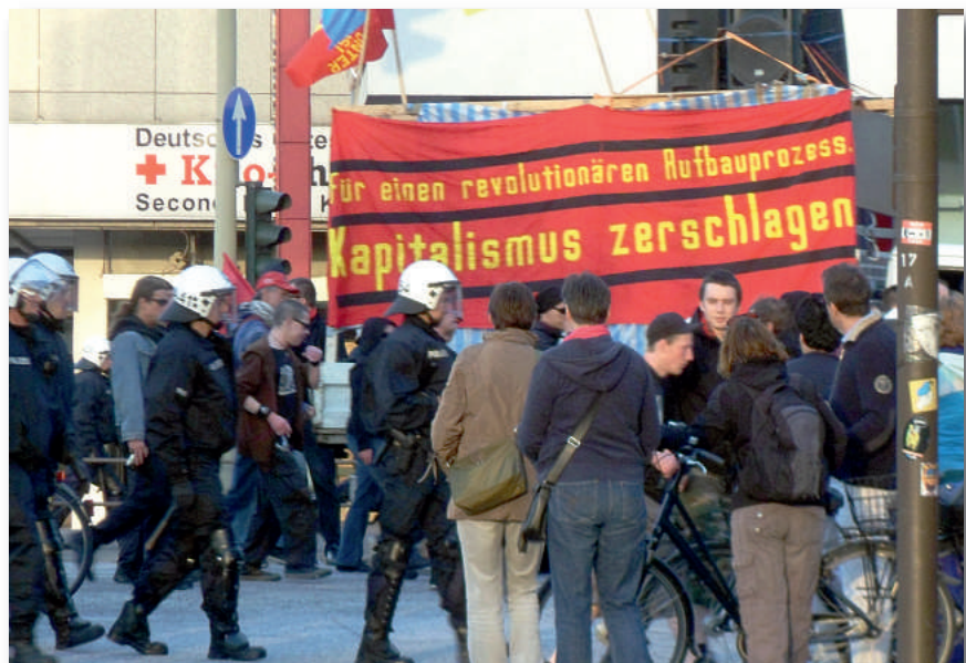
Tägliches Geschäft am 1. Mai: Begleitung des Antifa-Blocks

Kirsch weiter: „Das permanente und verständnisvolle ‚Schönreden‘ dieser Gewaltexzesse – insbesondere durch Vertreter der äußersten Linken – ist unerträglich. Als GdP erwarten wir, dass festgenommene Gewalttäter unnachsichtig von der Justiz zur Verantwortung gezogen werden!“