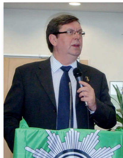
Konny warnte eindringlich vor den Gefahren des Rechtsextremismus.

Alle anwesenden Mitglieder des Fachbereiches Senioren waren von Konny's Vortrag so mitgenommen, sodass man mit