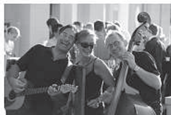
Sgt. Feffers Fun Fun Band