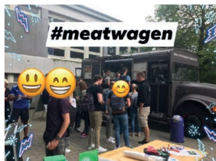
Tolles Sommerfest am PAZ zur Begrüßung der neuen Auszubildenden.