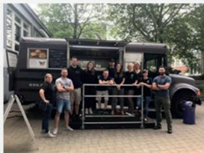
JUNGE GRUPPE - GdP Hamburg vor 16 Stunden

Zusammen mit dem Meatwagen, Polizei Memes, Blaulicht Memes und 5.11 Tactical haben wir heute einen Kennenlernetag an der Polizeiakademie in Hamburg veranstaltet.