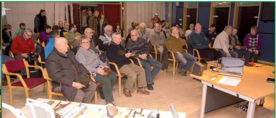
Bereits vor Beginn waren mehr Gäste als Stühle da.