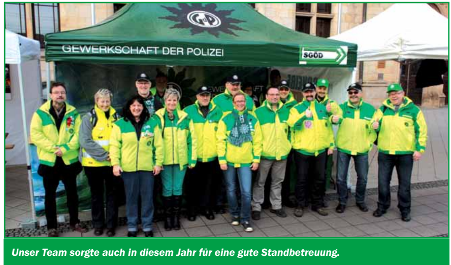
Unser Team sorgte auch in diesem Jahr für eine gute Standbetreuung.

Jens Hüttich, Landesredakteur www.gdp.de/gdp/gdplsa.nsf/id/20150306