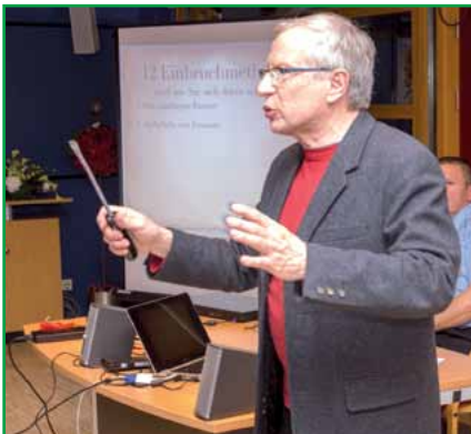
Der Autor während des Vortrages.