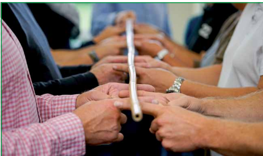
Hier geht es um die Konzentrationsfähigkeit aller Teilnehmer, ohne die die Übung nicht gelingt.