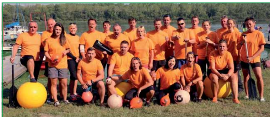
Das ist die Mannschaft „Die Blauen Drachen“.