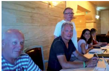
Danke an unser GdP-Betreuungsteam

burg-Vorpommern, wenn auch in der Minderheit. Unsere Ansprechpartner vor Ort für den touristischen Bereich