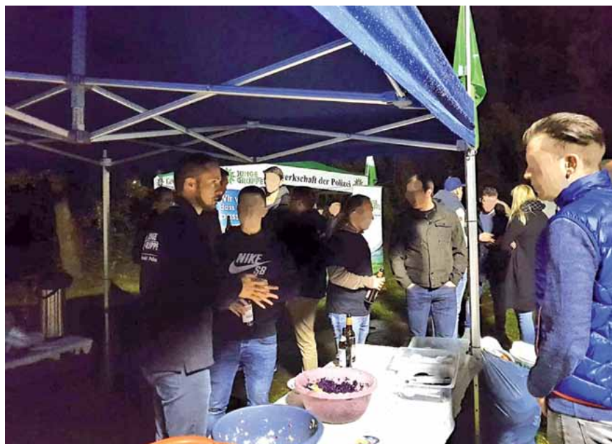
Das zweite Kennenlernn-Grillen hat am 10. Oktober an der Fachhochschule in Güstrow stattgefunden. Wie schon beim ersten Grillen sind viele Kolleginnen und Kollegen der Einladung der JUNGEN GRUPPE gefolgt. Danke an die Organisatoren!