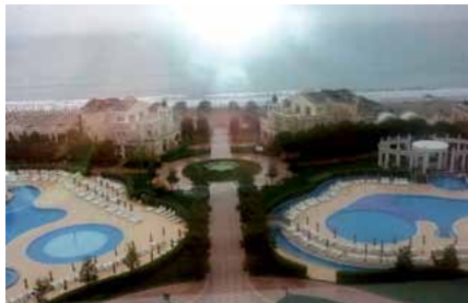
Blick aus dem Fenster des Hotels

burg-Vorpommern, wenn auch in der Minderheit. Unsere Ansprechpartner vor Ort für den touristischen Bereich