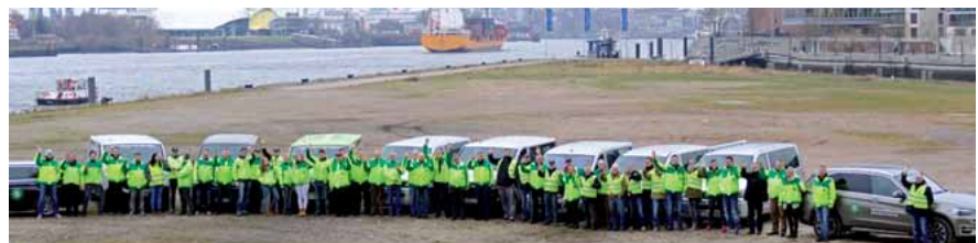
Von den Betreuer-Teams ein herzliches Hallo aus Hamburg!

Schwerin/Hamburg. Anfang Juli steht für die Polizei mit dem G20-Gipfel in der Hansestadt an der Elbe ein großer Einsatz bevor. Um den Tausenden Kolleginnen und Kollegen aus ganz Deutschland den sicherlich viel abverlangenden Einsatz ein wenig zu erleichtern, wird auch ein Großaufgebot an Betreuern der Gewerkschaft der Polizei (GdP) vor Ort sein. Wir hoffen auf ein friedliches und glimpflich ausgehendes G20-Treffen! Passt auf euch auf und kommt immer gesund aus den Einsätzen nach Hause.