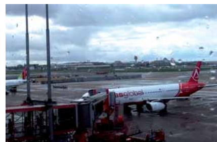
Ein Blick auf den Flughafen – ganz nah die Flieger

Ein absoluter Höhepunkt war die Exklusivrundfahrt auf dem gesamten Start- und Landebahnssystem. Auf der