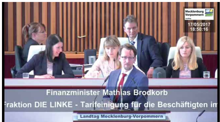
Mit den Stimmen der Regierungskoalition wurde der Antrag deutlich abgelehnt.

In seiner Sitzung am Mittwoch, dem 17. 5. 2017, beschäftigte sich der Landtag Mecklenburg-Vorpommern mit der Übertragung des Tarifergebnisses. Am Ende einer teilweise sehr hitzigen Debatte erfolgte die namentliche Abstimmung über einen Antrag der Fraktion DIE LINKE. In ihrem Antrag übernahm DIE LINKE die Forderung der GdP und forderte die zeit- und inhaltsgleiche Übertragung der Tarifergebnisse auf die Beamten und Versorgungsempfänger des Landes.