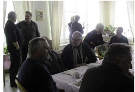
Lange nicht gesehen