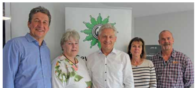
Die Mitglieder des Fachausschusses Kripo.

Eine Überarbeitung der Homepage der niedersächsischen GdP soll den Fachausschuss Kriminalpolizei leichter auffindbar machen. Veränderungen und Darstellungsmöglichkeiten wurden abgesprochen. Die Schwerpunktsetzung in dieser schnelllebigen Zeit von Terrorismus, Wohnungseinbruch, Organisierter Kriminalität, Verkehrsdatenspeicherung etc. wurde in