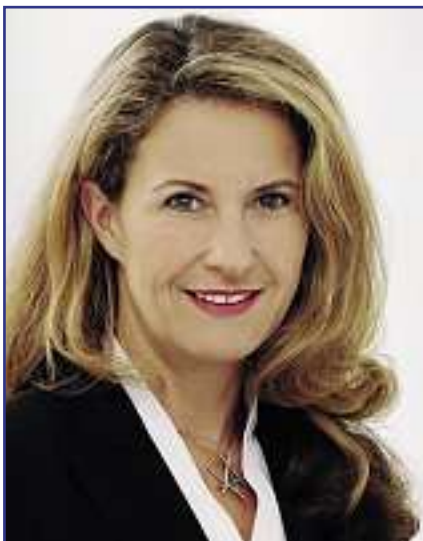
Innen-Staatssekretärin Heike Raab

Die Staatssekretärin antwortet auf den vom Fachausschuss Schutzpolizei initiierten Brief, in dem das gesundheitsschädliche Zusammenspiel von „normalen“ Autositzen und der am Gürtel getragenen Polizeiausrüstung thematisiert wird.