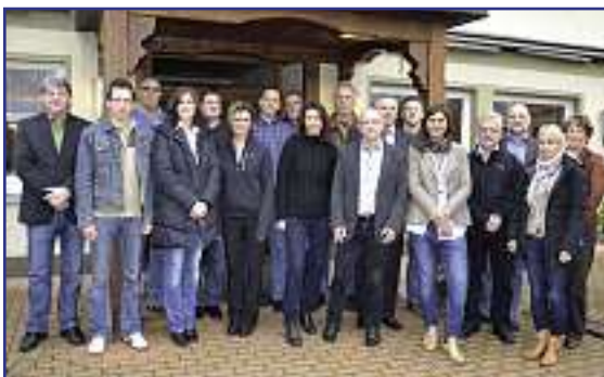
Delegierte, Vorstand, Kandidaten der BG Koblenz (links) und der BG Mainz (rechts)