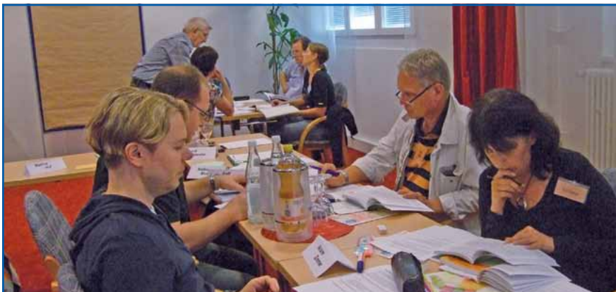
Die Lösung selbst erarbeiten: Teilnehmerinnen und Teilnehmer in Arbeitsgruppen.

Für die neu gewählten Vertreterinnen und Vertreter der Tarifbeschäftigten in den Personalrats-Gremien fand die erste Beschulung in Boppard statt.