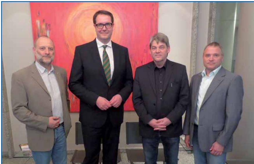
Schon als Landtagsabgeordneter und SPD-Generalsekretär war Alexander Schweitzer (2. v. l.) ein verlässlicher Ansprechpartner für die GdP. Ernst Scharbach, Bernd Becker und Dietrich Gödker gratulierten herzlich zur Ernennung zum Staatsminister für Arbeit, Soziales und Gesundheit.

Es gibt Themen, die im politischen Raum immer wieder einmal aufscheinen und genauso oft wieder totgeschwiegen werden und in Schubladen verschwinden. Ein solches ist die Forderung nach einer professionellen Leichenschau durch amtlich verpflichtete Ärzte.