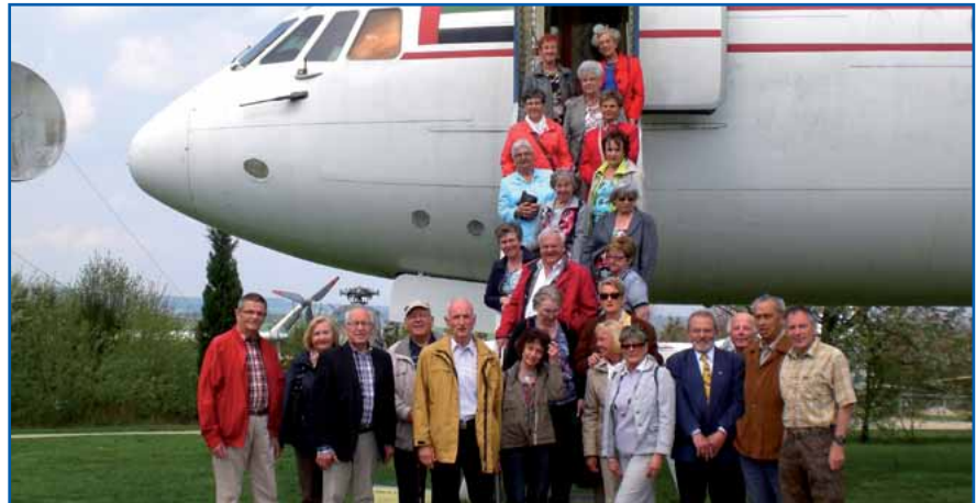
Gruppenbild mit Flieger: Koblenzer GdP-Senioren im Flugzeugmuseum Hermeskeil.

Eine längst zur Tradition gewordene Einrichtung der Koblenzer Kreisgruppe, der Jahresausflug der GdP-Senioren, fand wieder einmal an einem schönen Maientag statt.