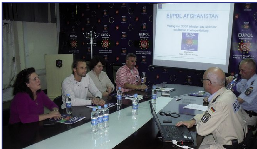
Personalräte aus mehreren Bundesländern im Gespräch mit Kollegen des „German Police Project Teams“. Sicherheit ist in Afghanistan ein wichtiges Thema.

Vorbereitet und mit vielen gut gemeinten Ratschlägen („Hast Du Dir auch eine Burka gekauft?“, „Nimm Deine Weste mit, dort ist Bombenstimmung“ und „Bist Du jetzt total bescheuert, komm bloß heil wieder!“) machte ich mich auf den Weg zum Flughafen. Meine Gedanken galten eher unseren Kolleginnen und