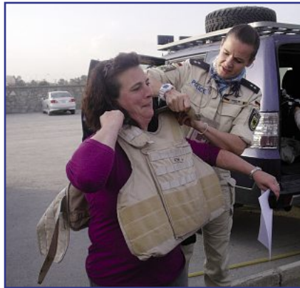
Sicherheit ist in Afghanistan ein wichtiges Thema

In vielen persönlichen Gesprächen mit unseren Kollegen und Kolleginnen konnte ich ihre ehrlichen Statements sam-