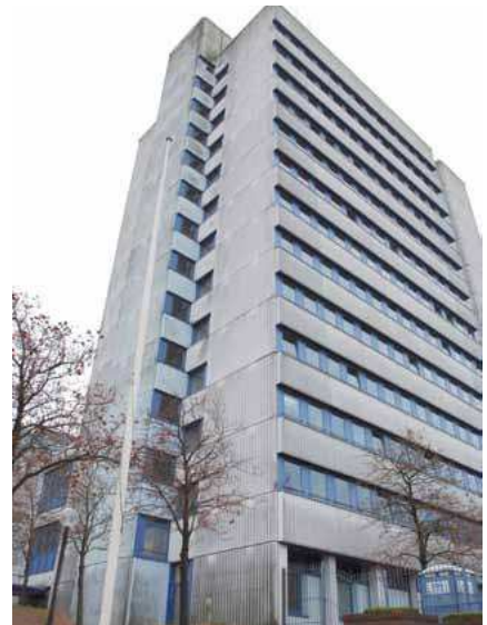
Das marode Dienstgebäude „Große Paaschburg 66“.