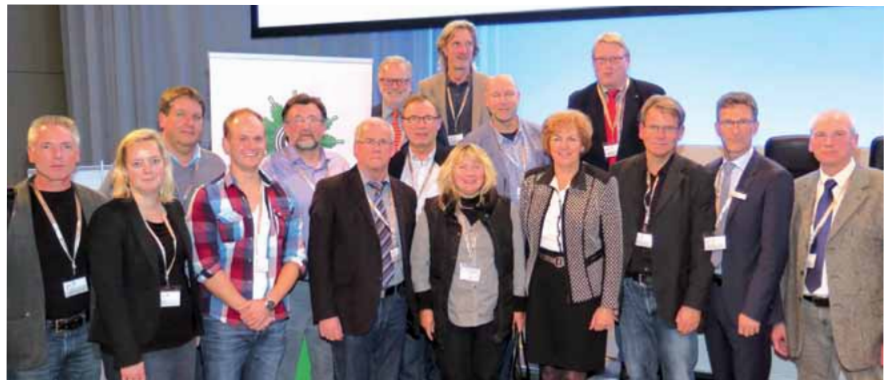
Die schleswig-holsteinische Delegation mit dem gewählten Bundesvorsitzenden Oliver Malchow.

Weitere Eindrücke vom Bundeskongress folgen in der nächsten Ausgabe des DP-Landesjournals.