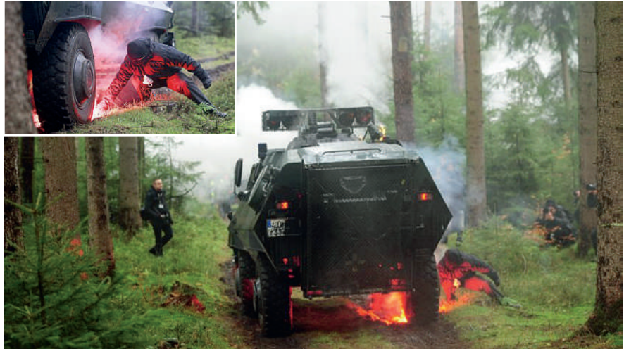
Der brennende Sonderwagen im Wald. Demonstranten legen Feuer unter dem Fahrzeug, Fotografen machen Bilder.

Doch es ist nicht nur die Dauer des Einsatzes. Temperaturen unter null Grad, kaum Essen, kilometerlange Märsche – und das alles mit einer 15 Kilogramm schweren Schutzausrüstung am Körper. Im Einsatz an den Gleisen, fern von den zentralen Stellen, gibt es keine warme Suppe, keinen Kaffee, keine Toilette. „Wir Frauen trinken möglichst wenig, damit wir nicht aufs Klo müssen“, verrät Gruppenführerin Nadine Träger (32). Und riskieren, zu dehydrieren. Ein Snickers war das einzige, was sie in 25 Stunden aß. Nahrung und Wasserflaschen sind schwer und schnell aufge-