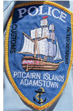
Das Polizeiembleme von Pitcairn Island

der für ein Jahr zur einmännigen Station Adamstown auf Pitcairn Island abgeordnet ist, den Blick nach Südwesten, dann liegen zwischen ihm und seiner Heimat Neuseeland 5200 Kilometer Pazifik ohne eine einzige weitere Insel. Wichtig ist, dass der Inselpolizist sich mit diplomatischem Geschick in diese kleine Inselbevölkerung inte-