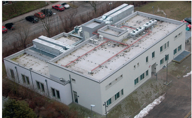
In Kürze soll auch die Lübecker Regionalleitstelle ihrer Bestimmung übergeben werden.

Derzeit sind dezentrale Befeuchtungsanlagen mit einer geringen Befeuchtungsleistung in der Leitstelle aufgebaut. Um eine dauerhaft ausreichende Luftbefeuchtung zu erreichen, müsste die Luftleistung der Klimaanlage angepasst werden. Dies scheitert an der notwendigen Abfuhr der durch die Technik erzeugten Wärmelasten. Ein Konzept zum nachträglichen Einbau einer zentralen Befeuchtungsanlage, das von allen Beteiligten getragen wird, liegt vor. Die hierfür erforderliche Tech-