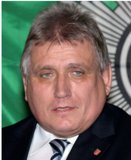
Innenminister Klaus Schlie

Kiel – In einer Pressemitteilung verkündete Schleswig-Holsteins Justizminister Emil Schmalfuß Anfang Januar die strukturelle Neuregelung des Richterlichen Bereitschaftsdienstes. Bemerkenswert für die Polizei: Schmalfuß wies darauf hin, dass damit auch das Verfahren bei Blutproben eines mutmaßlichen Alkoholsünders im Strafverfahren weiter maßgeblich vereinfacht werde. Nach Auffassung der GdP ändert sich damit jedoch an der nach wie vor bestehenden