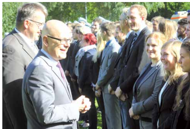
...und im Austausch mit angehenden Kriminalbeamten/-innen.