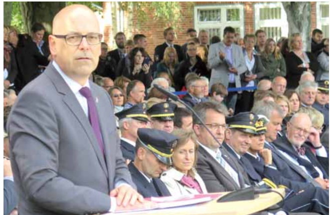
Ministerpräsident Torsten Albig sprach bei der Vereidigung und würdigte die Rolle der Polizei bei der Flüchtlingsproblematik.

„Es sind Polizistinnen und Polizisten, die uns mit den Flüchtlingen helfen, die uns in der Logistik unterstützen und die in den Erstaufnahmen das Gesicht eines freundlichen deutschen Staates sind“, hob der Ministerpräsident hervor. Er sehe junge Polizeianwärter aus Eutin, die Betten schleppten, um die Erstaufnahme in Kiel bezugsfertig zu machen. Er sehe Mitarbeiter der Landespolizei, die Transporte organisieren, Leitungen legen für IT und Kommunikation, oder die rund um die Uhr für die Sicherheit in den Erstaufnahmen sorgen. „Landesweit unterstützt uns die Polizei bei Administration und Logistik. Ich finde das großartig und bin sehr dankbar für diese Hilfe“, war Albig spürbar angetan und voll des Lobes. Und Albig weiter: Diese Hilfe stärke das Ansehen der Polizei noch weiter. Der Polizeiberuf sei bereits hoch angesehen und beliebt. Umfragen zeigten das immer wieder. „Wenn unter den Flüchtlingen das Ansehen