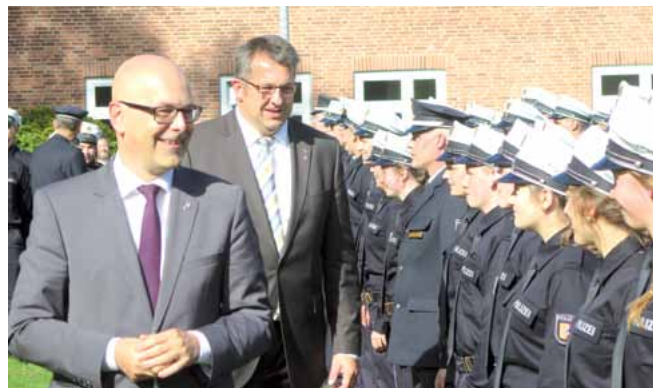
Ministerpräsident Albig und Innenminister Studt im Gespräch mit dem Polizeinachwuchs in Uniform ...

„Die Entscheidung zur Einstellung von zusätzlichen Anwärterinnen und Anwärtern ist richtig und mehr als überfällig“, kommentierte der Stell-